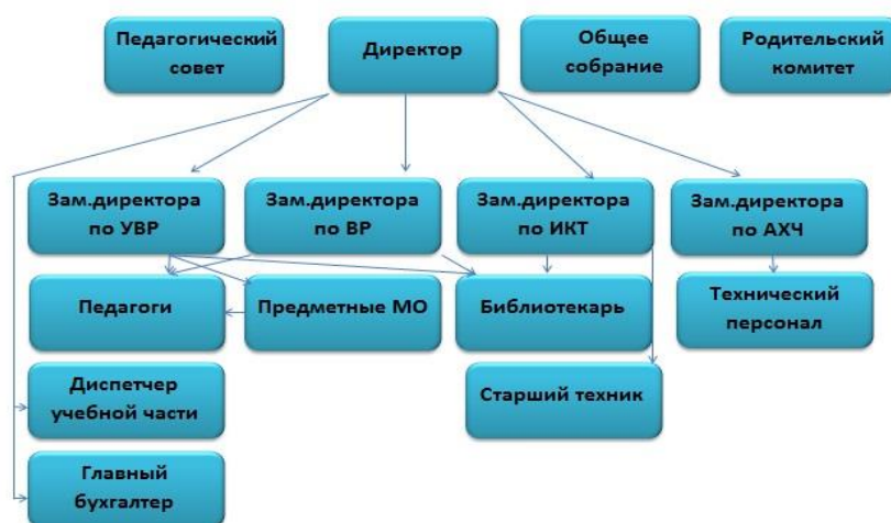
Схема структуры управления

Родительский комитет - принимает решение о содействии руководству школы в совершенствовании условий для осуществления образовательного процесса, охраны жизни и здоровья, гармоничного развития личности ребенка; в защите законных прав и интересов детей; в организации и проведении массовых воспитательных мероприятий.